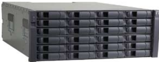
Abbildung 1) Das DS4243 Platten-Shelf – maximale Kapazität und Performance