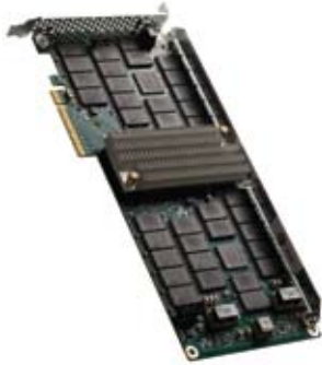
Abbildung 3) NetApp Flash Cache